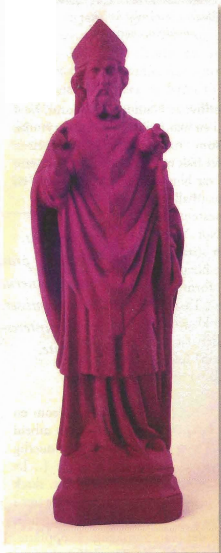
St. Nicholas, Katharina Fritsch 2002, malt polyester