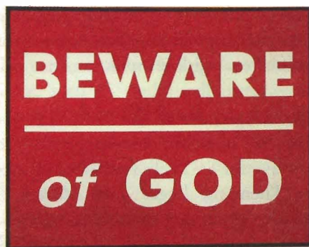
Beware of God, Scott Grieger 1996, akryl på lerret