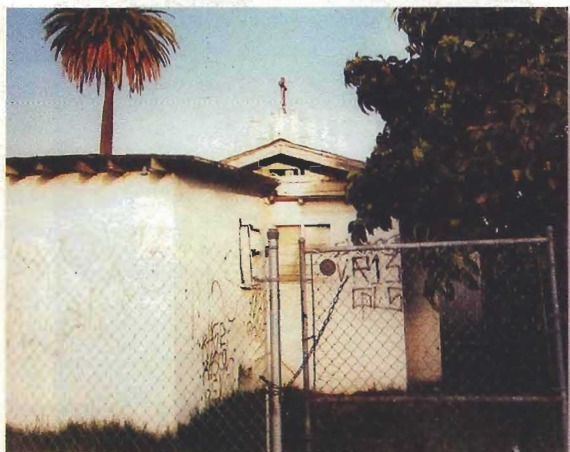
R.M Schindler Church, Sam Durant 2001