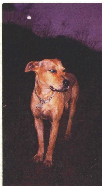
New Dog and New Moon, Chris Burden 2001