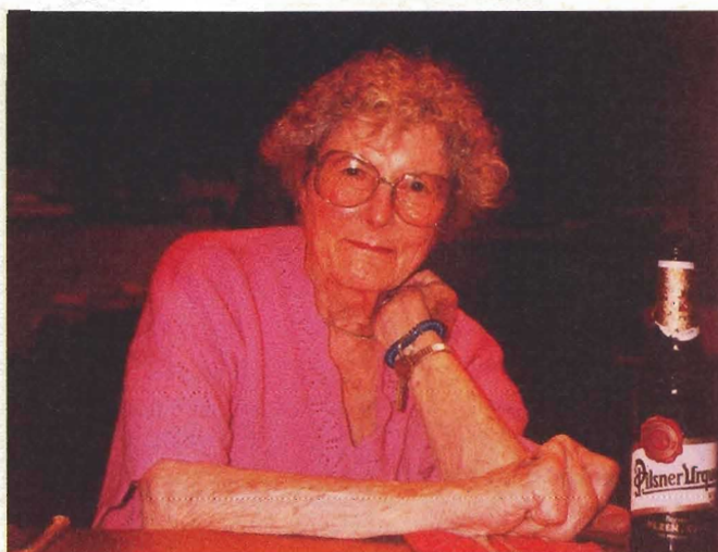
You don't have to understand me, you only have to love me, Liz Larner 2003.